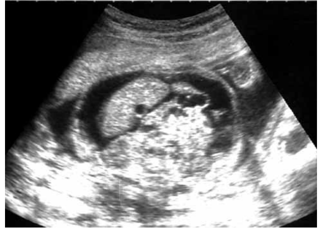
Figura 1. Ecografía prenatal a las 29 semanas de gestación. Corte transversal de la cavidad abdominal en la que puede apreciarse ascitis.

Se presenta el caso de un lactante varón remitido a nuestro centro a los 2 meses y medio de edad para estudio por ascitis e hidrocele. Se trata del primer hijo de padres jóvenes, ambos fumadores, con antecedente en el padre de pólipos intestinales. El niño procede de una gestación de 37 semanas, controlada. En la semana 29 de gestación se detecta mediante ecografía ascitis e hidrocele en el feto (Fig. 1). Se realiza amniocentesis que muestra cariotipo XY normal y cultivo estéril. La serologías para toxoplasma, rubéola, VIH, virus herpes simple, citomegalovirus, virus varicela-zóster, hepatitis B y C, y parvovirus B19 resultan negativas. En la semana 36 se realiza nueva ecografía que muestra polihidramnios, ascitis, hidrocele y posible derrame pleural derecho, por lo que se induce el parto. Presenta peso al nacer de 3.700 g y longitud 50 cm, con edemas generalizados e hidrocele bilateral a tensión. El estudio cardiológico (radiografía de tórax, electrocardiograma y ecocardiogra-