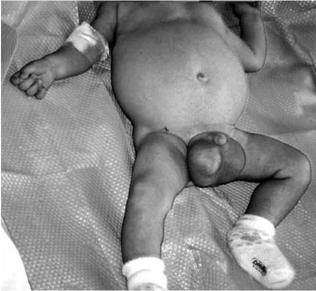
Figura 2. Fotografía del paciente a los 2 meses y medio de edad, antes de comenzar el tratamiento dietético. Llamen la atención la ascitis y el hidrocele bilateral.

principios activos en heces de 72 horas y tránsito gastrointestinal, resultando ambos normales. La TAC abdominal no muestra otros hallazgos al margen de la ascitis. Una linfogramagrafía con 99 Tc-nanocoloides muestra acúmulo de radiotrazador abdominal bajo y la biopsia yeyunal encuentra dilatación de los vasos linfáticos con atrofia parcial de vellosidades (Fig. 3). Inicialmente se instauró tratamiento con furosemida intravenosa y seroalbúmina al 20% (1 g/kg peso/día) durante 6 días, con desaparición de taquicardia pero sin mejoría de ascitis e hidrocele. Posteriormente se prueba dieta especial mediante fórmula completa con 93% de lípidos en forma de triglicéridos de cadena media (Monogen, SHS Internacional Ltd., Reino Unido) con lo que se consigue desaparición paulatina de la ascitis y el hidrocele, siendo alta a los 19 días más tarde.