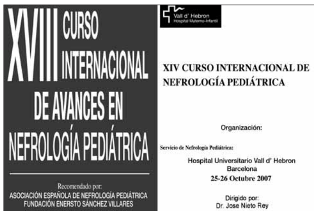
Figura 2. Programas de los Cursos de Nefrología Pediátrica celebrados en Oviedo y Barcelona en el año 2007.

primer Servicio de Nefrología Pediátrica y 34 años después de la fundación de la AENP, no está regulada la formación de nefrólogos pediatras ni existe ninguna titulación oficial que reconozca esta actividad, como sucede en otros países europeos desde hace bastantes años (13) . Resulta, pues, evidente que los niños con patología nefrológica pueden ser atendidos por pediatras con grandes diferencias de formación en ese campo, sin que se pueda asegurar que tengan una cobertura asistencial eficiente y uniforme en todo el territorio español.