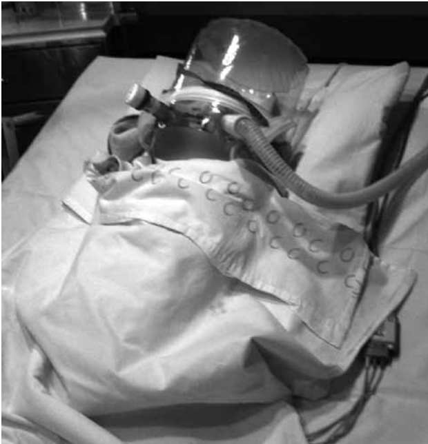
Figura 2. Interfase tipo helmet .

ten interfases alternativas que debemos conocer: sistemas de almohadillas binasales tipo Adams, casco o helmet (Fig. 2), mascarilla facial completa, mascarilla bucal, sistemas alternativos neonatales (prótesis intranasal, binasal, cánula nasal y prótesis nasofaríngea) (5) .