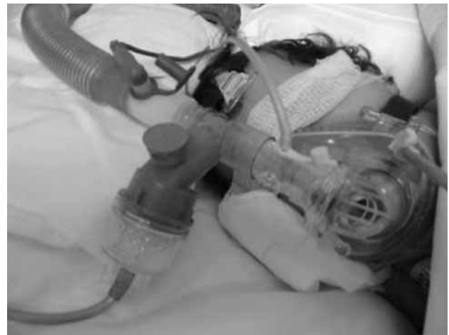
Figura 1. Interfase tipo mascarilla buconasal.

La presencia de lesiones en la zona de apoyo de la interfase imposibilita su aplicación; además la propia presión positiva en presencia de fracturas etmoidales ha sido asociada a herniación orbitaria. Algunos autores postulan la posibilidad de un mayor riesgo de meningitis postraumática en pacientes con fístula de LCR si se aplica VNI.