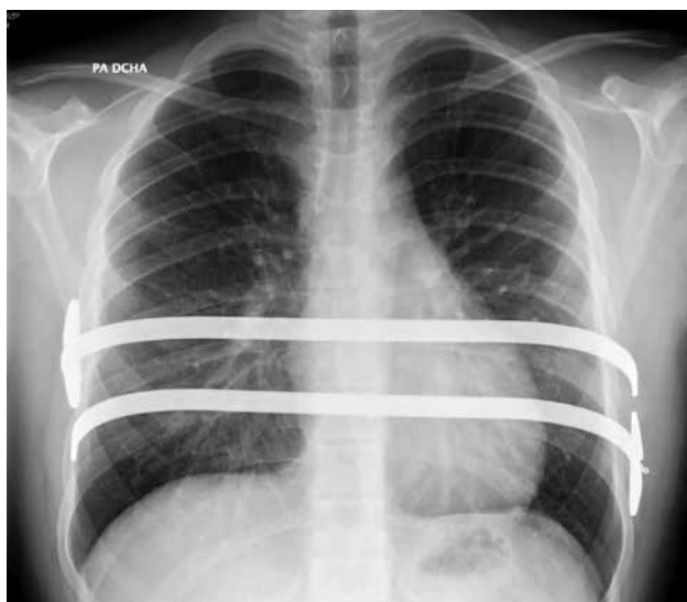
Figura 3. Pectus excavatum intervenido por técnica de Nuss mediante la colocación de dos barras de Lorenz.