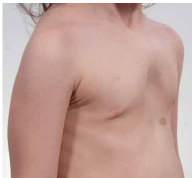
Figura 4. Pectus arcuatum en niña de 5 años.

El seguimiento clínico estrecho y las mediciones externas del tórax (incluidas medidas digitales en 3D) constituyen la base del diagnóstico, que se completa con una TC de tórax en los casos en que se prevea una corrección quirúrgica para conocer los índices de hundimiento y de asimetría de la pared torácica. El estudio cardiológico es mandatorio en los casos severos y las pruebas de función pulmonar presentan escasa utilidad en la práctica clínica diaria.