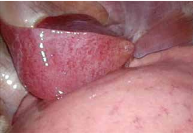
Figura 2. Secuestro pulmonar extralobar en lactante de 10 meses (imagen toracoscópica).