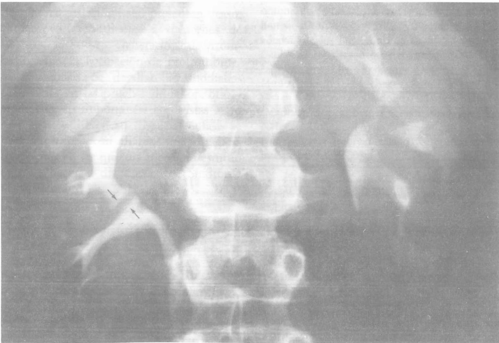
FIG. 3. Mismo hallazgo de la Fig. 2 ampliado y localizado

El empleo de procedimientos diagnósticos o terapéuticos agresivos como la angiografía o la intervención quirúrgica, no están indicados salvo en casos excepcionales en que