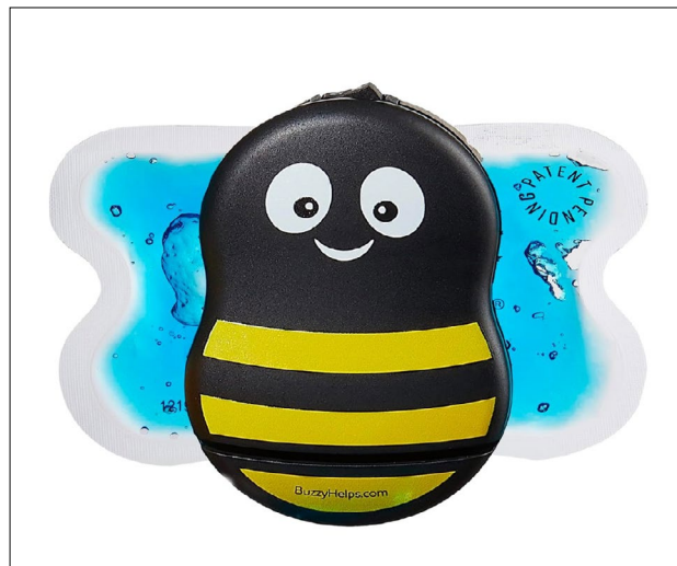
Figura 1. Dispositivo Buzzy®.

Entre los métodos no farmacológicos se encuentra Buzzy® (figura 1), diseñado para disminuir el dolor y el estrés en niños. Este dispositivo combina distracción y analgesia física mediante frío y vibración, y ha sido evaluado durante venopunciones, canalizaciones intravenosas e inyecciones (8) . La teoría neurofisiológica sugiere que el frío y la vibración