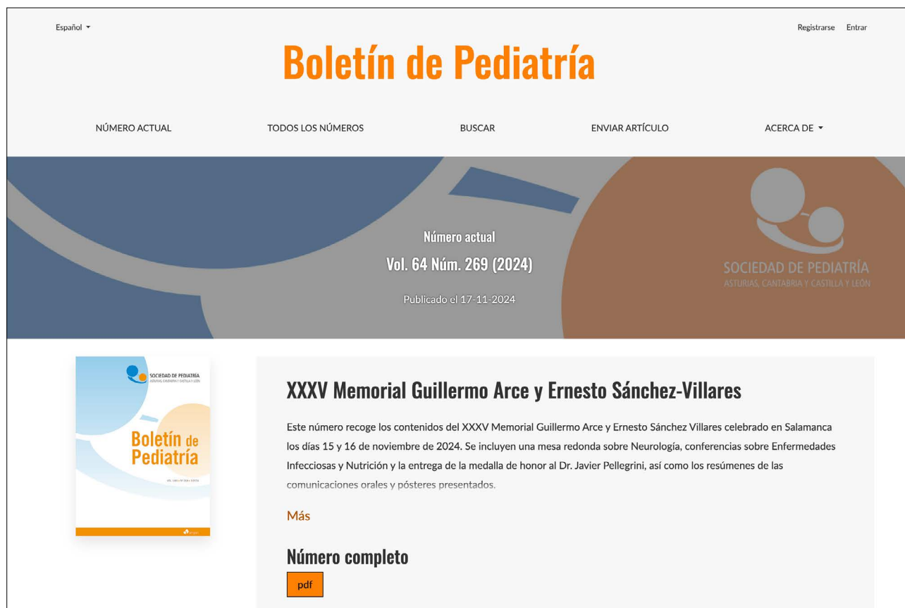
Figura 1. Aspecto actual de la página de inicio de la nueva web boletindepediatria.org

Core Metadata Initiative (DCMI) y también almacenaba metadatos como las palabras clave (en castellano e inglés) y los datos de los autores para facilitar su indexación por servicios como Google Académico o el Directory of Open Access Journals (DOAJ). Durante esta etapa también se comenzaron a digitalizar números anteriores a 1997 para su inclusión en la web, llegando a completar todos los números entre 1989 y 1995.