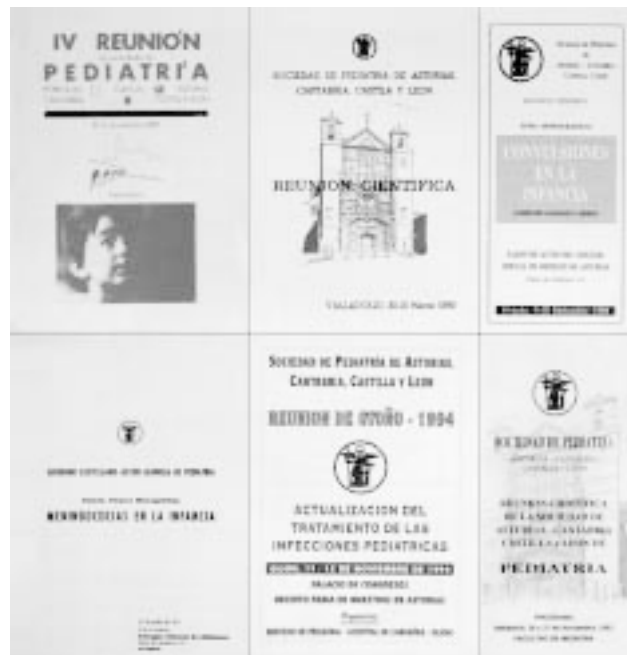
Portada de varios programas de Reuniones Científicas celebradas en nuestra Sociedad.

Del 26 al 28 de junio de 1997 se celebra en Oviedo el